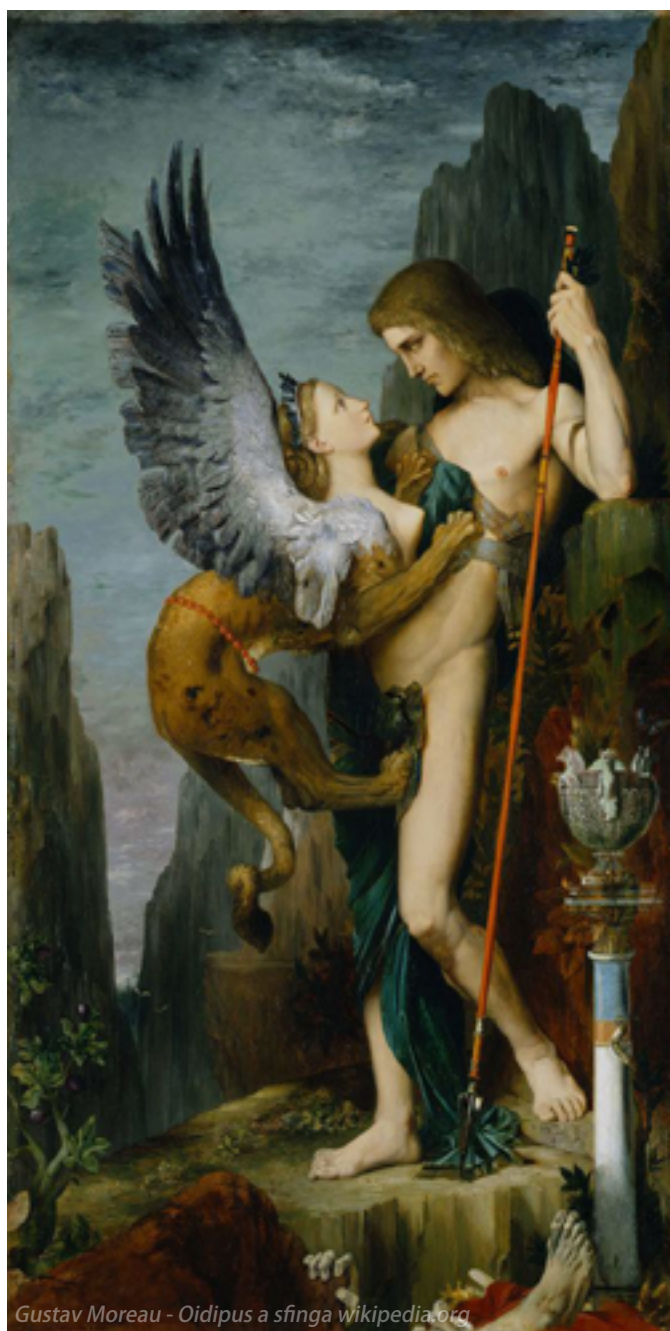
Gustav Moreau - Oidipus a sfinga

V pradávnych časoch sa pri meste Théby usadila tajomná a všetkými obávaná bytosť – sfinga. Jej majestátny zjav a prenikavý zrak naháňal hrôzu každému, kto sa k nej priblížil. Ba čo viac, sfinga nemilosrdne strážila vstup do posvätného mesta. Všetkým pútnikom, ktorí sa do mesta chceli dostať, dávala hádanku. Kto nevedel odpoveď, toho sfinga zhodila zo skaly do mora, pretože taký človek nebol pripravený vkročiť na pôdu múdrosti, ktorú Théby predstavovali. Jedného dňa sa k Thébam priblížil pútnik Oidipus.