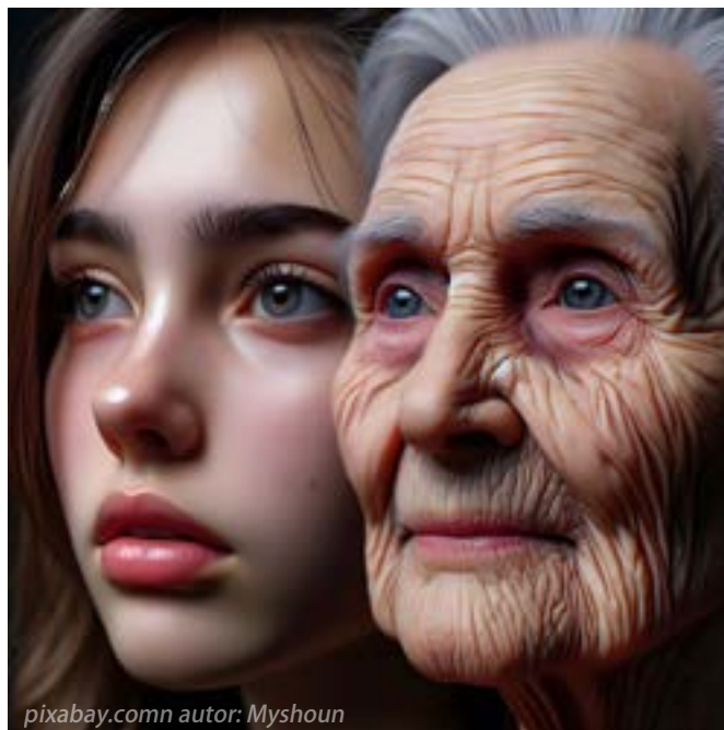
pixabay.comn autor: Myshoun

rozhodne nie v psuche, ktorá tiahne k neúnavnému hľadaniu vzrušenia; rozhodne nie v mysli túžiacej po poznatkoch.